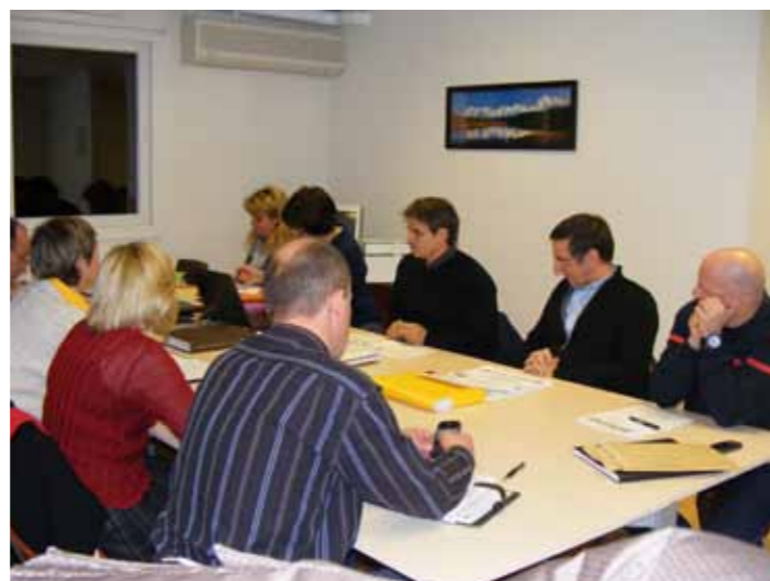
Comité syndical du SMITOM de Tarentaise du 11 février 2010 à Valezan.

D'autres groupements de communes actuellement clients du SMITOM devraient adhérer au 1 er janvier 2011 : la Communauté de communes Cœur de Tarentaise, la Communauté de communes des Vallées d'Aigueblanche et le SIVOM de Bozel.