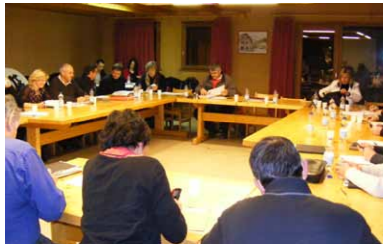
Vote du budget lors du Conseil Communautaire du 15 février 2010 à Séez.