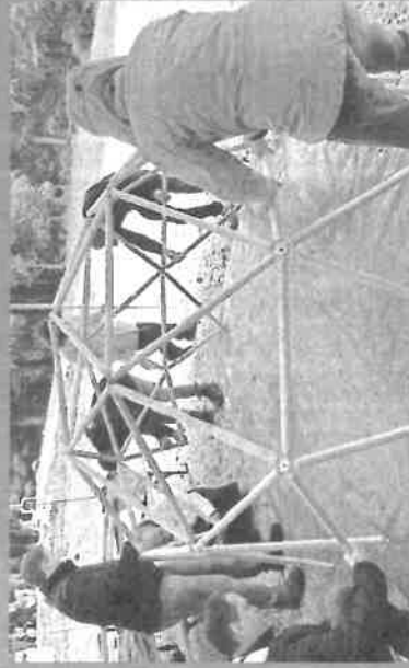
Création pédagogique CAUE de Savoie Gouvernement de la Savoie - Département de Savoie - 2022 - Le Paysan Le Centre de la Savoie - Mairie de Bourg - 2022 Page de la Savoie - Mairie de Bourg - Mairie de Bourg - 2022

CAUE de Savoie 28 Rue de la République CS 43552 73125 CHAMBERTAN www.caue-savoie.org caue@savoie.org tel : 04 79 60 7250