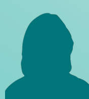
Laurence FONTAINE Commission n°3