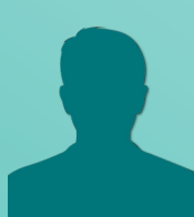
Éric JACQUEMOUD Commission n°1